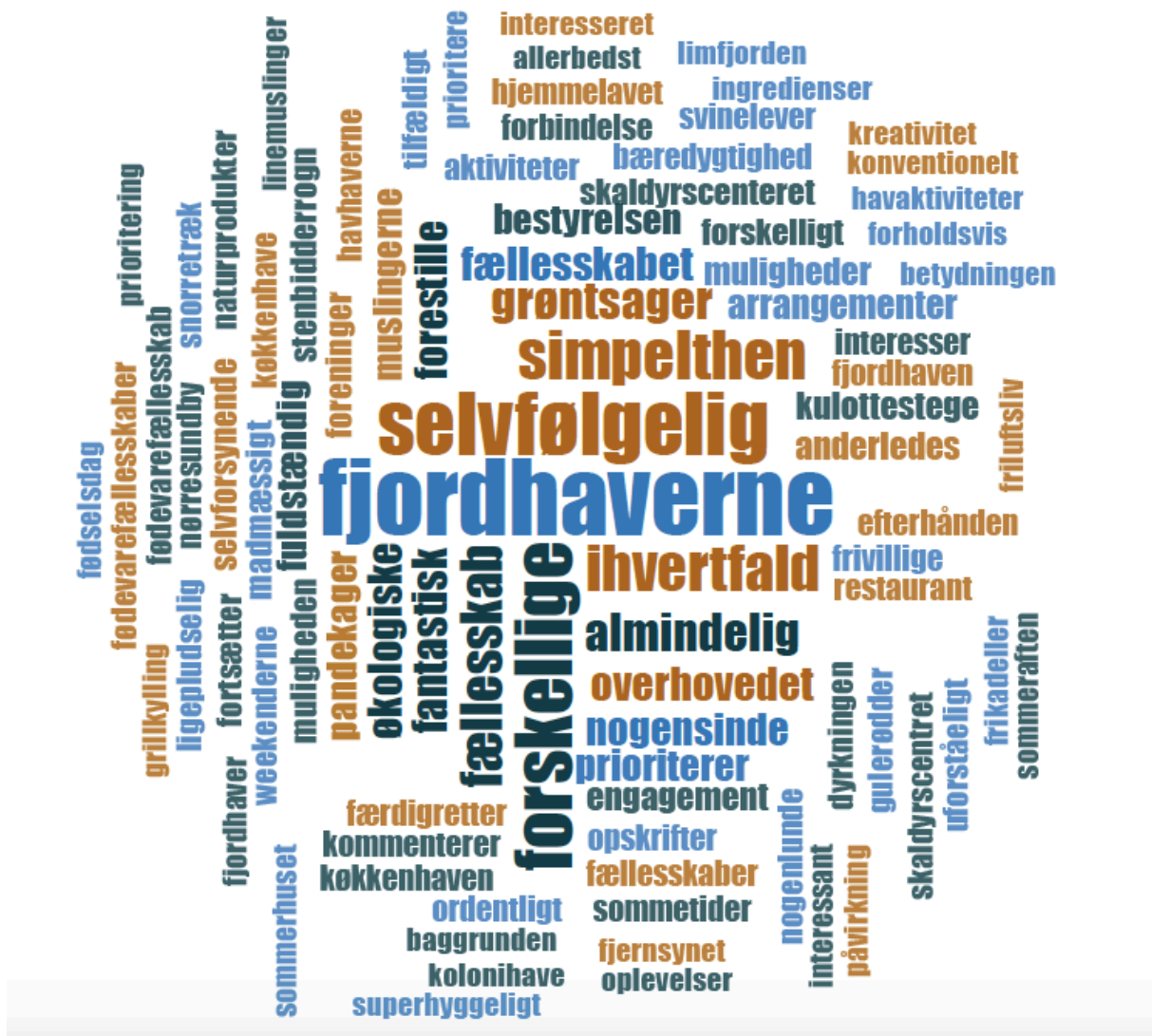
Kilde: eget arbejde i Nvivo