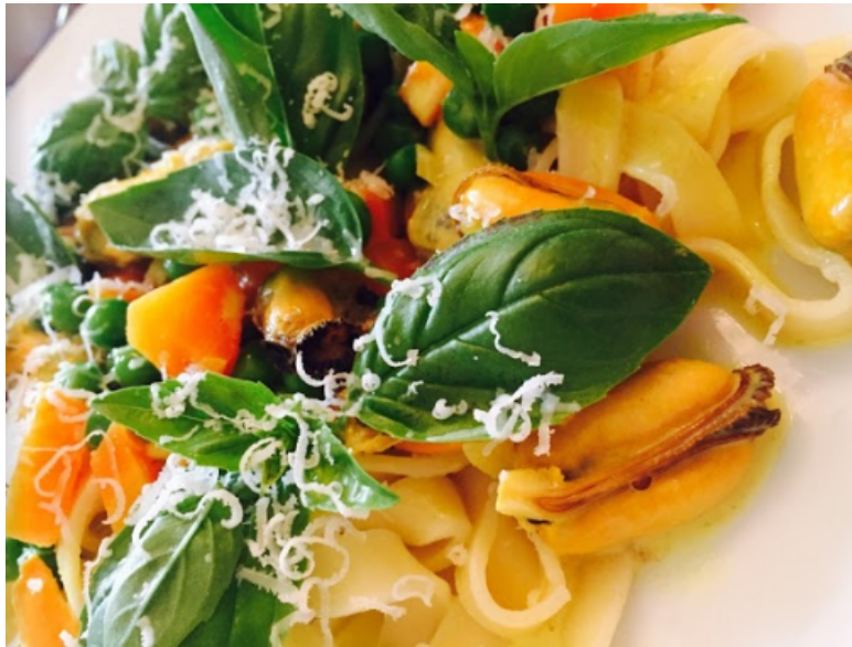
“Pastaret med karry og basilikum – og naturligvis muslinger direkte fra Fjordhaven.” (A & B, foto.)